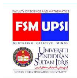
Figure 1. The logo of Department of Mathematics