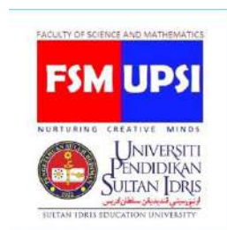
Rajah 1. Logo Fakulti Sains dan Matematik